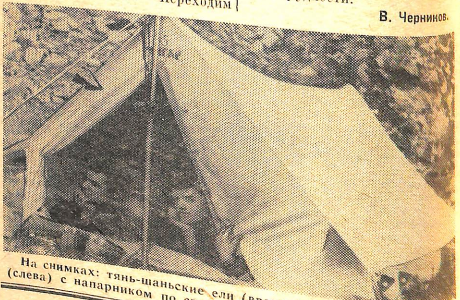
На снимках: тянь-шаньские ели (вверху). Внизу: автор этих строк (слева) с напарником по связке Н. Стрикицей.